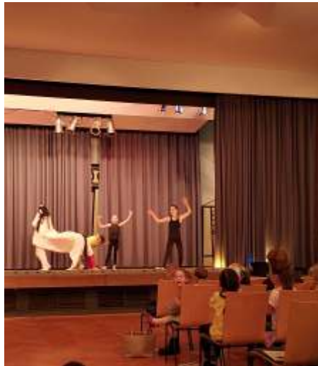
Kinderweihnachtsfeier in der Aula der Bertha-Krupp-Schule