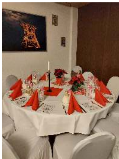
Festlich geschmückter kleiner Saal